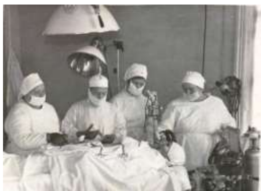
Хирургическое отделение Константиновской ЦРБ МА Константиновского района, фотокаталог