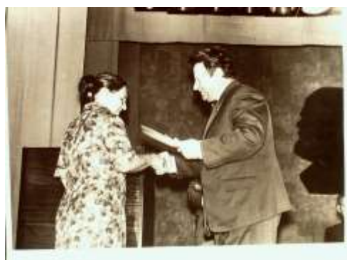
Учительская конференция, 1972г МА Константиновского района, фотокаталог