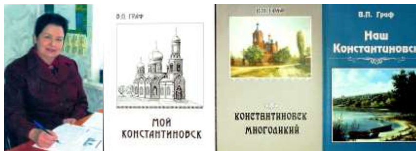
МА Константиновского района Ф.Р-18, Оп.1, Д.11

Архив хранит большое количество фотоснимков, сделанных фотоаппаратами в разные годы советского периода, а также фотоальбом