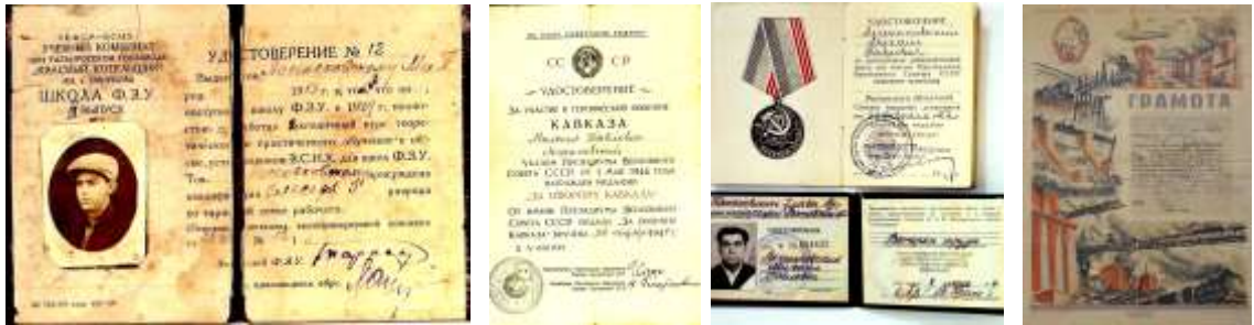
МА Константиновского района Ф.Р-25.Оп.1.Д.3, Л.1