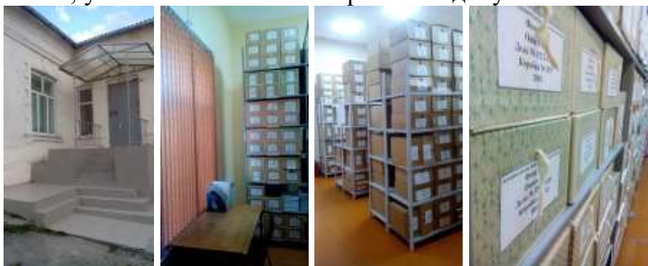
МА Константиновского района

Новый архив имеет три архивохранилища и рабочий кабинет. Помещения архивохранилищ оборудованы металлическими стационарными стеллажами протяженностью 520 погонных метров. Общая площадь архивохранилищ составляет 122,4 кв.м. Архив оснащен компьютерной, множительной техникой, визуализатором для перевода архивных документов в электронный вид. Много изменений архив претерпел за эти годы, но основные его функции остались неизменными, это – хранение, комплектование, учет и использование архивных документов.