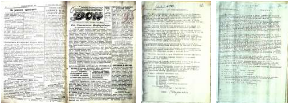
МА Константиновского района Ф.Р-85.Оп.1.Д.3, Л.9-10; Ф.Р-19.Оп.1.Д.131, Л.28-29

Уникальным документом является письмо т.Сталину жителей Константиновского района, написанное в 1944 году, ровно через год после освобождения района от немецко-фашистских захватчиков.