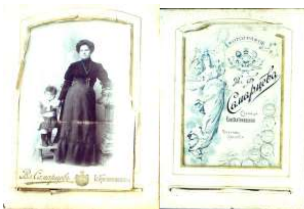
МА Константиновского района, фотокаталог

дореволюционного периода, который в составе своем имеет фотоснимки, сделанные в 1915г в ст. Константиновской.