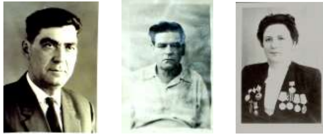
МА Константиновского района Ф.Р-30.Оп.1.Д.27, Л.3; Ф.Р-42.Оп.1.Д.3, Л.2; Ф.Р-42.Оп.1.Д.5, Л.1