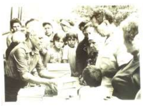
Школьный базар, 1985г. МА Константиновского района, фотокаталог

Фотографии отображают общественную, а также личную жизнь людей Константиновского района. Они не выделены в отдельный фонд, а распределены во многих фондах, например, в составе фондов личного происхождения или архивных коллекциях.