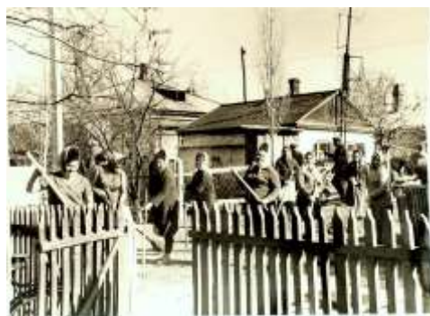
Ленинский субботник, 1972г МА Константиновского района, фотокаталог