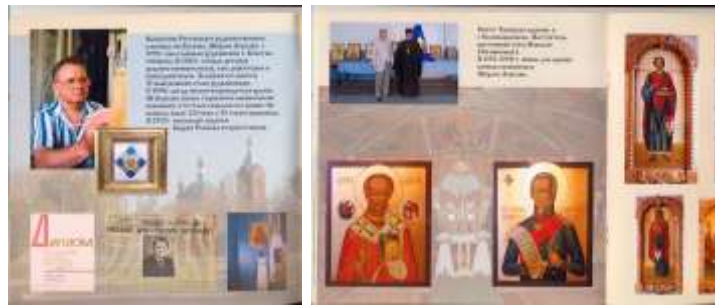
МА Константиновского района Ф.Р-23.Оп.1.Д.3, Л.1,5